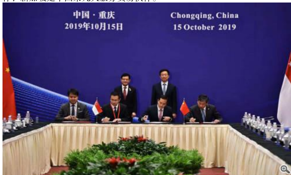
中新双边合作联委会第十五次会议签字仪式

46.7%，金融占12.8%，保险占8.5%，商业管理占6.9%，其中占新对全球出口份额较大的类别包括保险、运输、知识产权、个人文化休闲服务，比重分别为11.7%、8.7%、6.2%和6.1%。中国是新加坡第三大服务贸易伙伴，新加坡是中国第九大服务贸易伙伴。