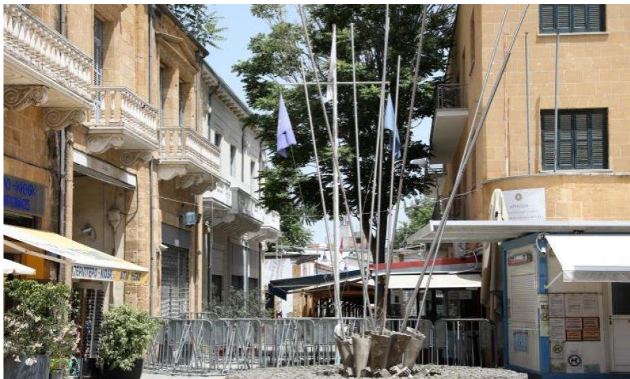
尼科西亚利德拉街过境点