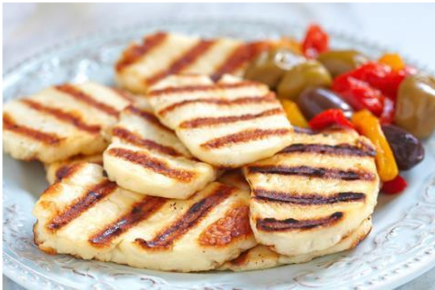
塞浦路斯特产哈鲁米奶酪

【农业】塞浦路斯农业规模不大，产量有限，以特色见长。根据塞浦路斯统计局数据，2020年塞浦路斯农业产值3.92亿欧元（按现价计算）。哈鲁米奶酪、土豆、果汁等是塞主要的出口产品。