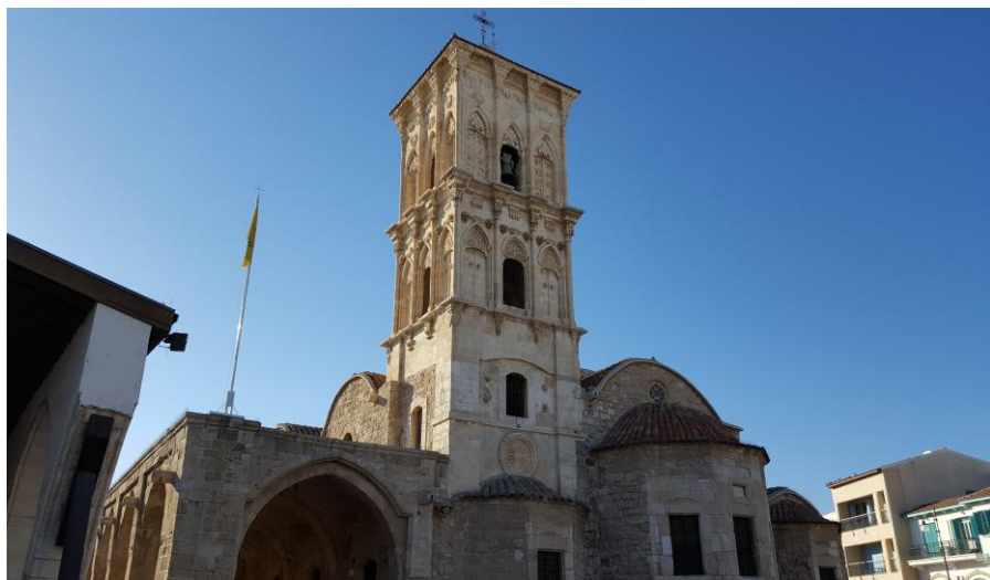
拉纳卡圣拉撒路教堂

当地许多风俗大都与宗教有关，复活节为最盛大的宗教节日，受到重视的程度甚至超过圣诞节。在参观教堂等宗教场所时，应避免穿着短裤和无袖衣服。