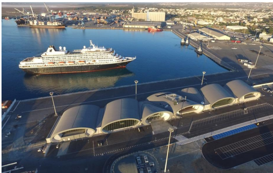
利马索尔游轮码头

塞浦路斯主要港口有利马索尔、拉纳卡两个多用途港口，瓦西里科（Vassiliko）工业港口，以及莫尼（Moni）、德克里亚（Dekeleia）两个游轮码头。大约70条国际海运航线把塞浦路斯列入其固定航线，穿梭于五大洲之间。利马索尔港是全国最大和最主要的港口，集中了全国95%以上的集装箱业务和大部分散货业务。根据国际债权人的要求，塞浦路斯政府决定对利马索尔港口私有化。2016年，经过招标程序，塞浦路斯政府将游轮及综合码头运营权和集装箱码头运营权分别交由迪拜码头世界公司和德国欧洲之门公司运营。经过升级改造，集装箱码头吞吐能力达到50万标箱，新建的游轮码头在2017年投入使用。2019年，游轮码头接待游轮93次，游客12.5万人次，同比增长40%。2020年疫情中断了游轮到港计划。2021年，皇家加勒比等主要游轮公司重启部分利马索尔的航线。