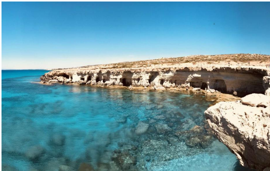
阿依纳帕（圣纳帕）海洞

【旅游业】旅游业作为塞浦路斯第三产业的龙头，在国民经济中发挥着支柱作用。塞浦路斯旅游资源丰富，既有蓝天、碧海、沙滩，也有城堡、教堂、葡萄园。塞浦路斯坐拥850公里海岸线、65个蓝旗海滩，99.1%的海水浴场水质“极好”，比例为欧盟最高。“阳光、沙滩、海水”成为塞浦路斯吸引游客的三大法宝。塞浦路斯是典型的地中海气候，夏季长达半年，干燥炎热，适宜水上运动，是旅游旺季。冬季短暂，温润多雨，山顶有滑雪场，可以一天之内上山滑雪、下海游泳。根据欧盟统计局数据，疫情前，塞浦路斯旅游业对GDP贡献率在15%左右，提供了约5万个就业岗位，占非金融类就业岗位的20%。2020年，受新冠肺炎疫情冲击，塞浦路斯旅游业损失惨重。全年访塞游客仅64万人次，同比下降84.1%，旅游业收入3.92亿欧元，同比下降85.4%。