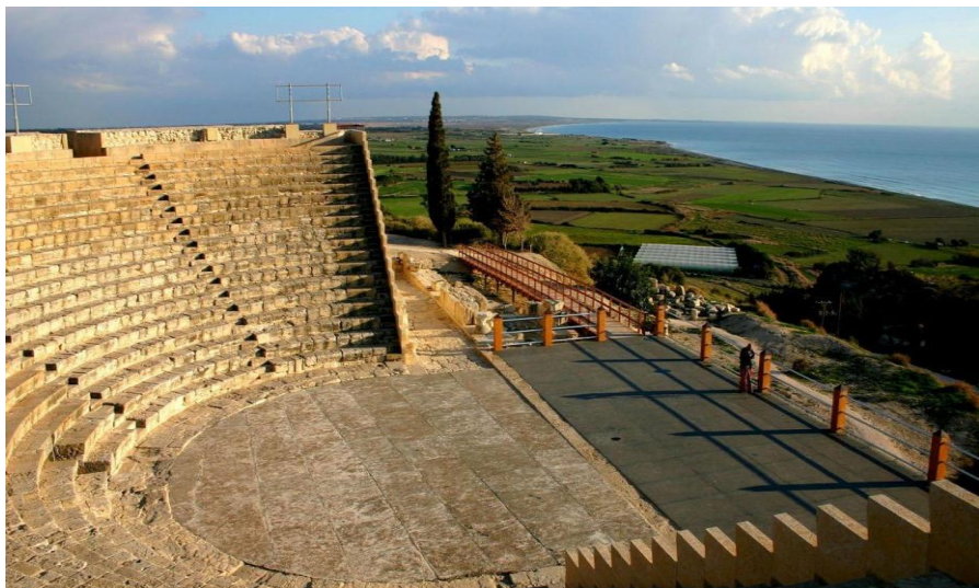
库伦剧场考古遗址

塞浦路斯主要有希腊族（简称“希族”）和土耳其族（简称“土族”）两大民族。塞浦路斯分裂前希土两族混居，从1974年7月开始，希腊族主要居住在塞浦路斯南部，土耳其族主要居住在塞浦路斯北部。此外，在土族控制的北部地区还有来自土耳其的移民居住，塞浦路斯政府一直未承认这部分移民的合法身份。